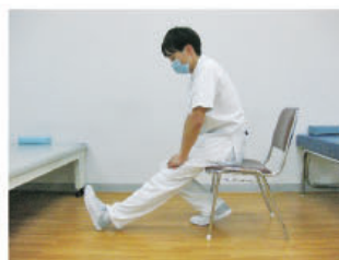
裏もも～ふくらはぎへのストレッチ