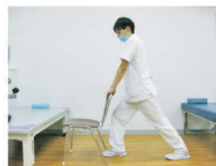
アキレス腱のストレッチ