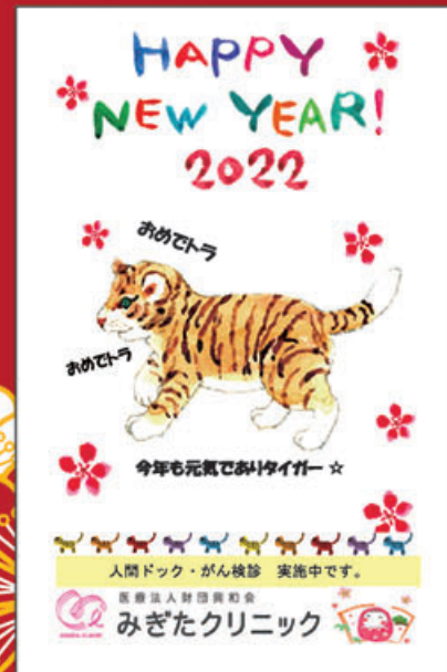
みぎたクリニック