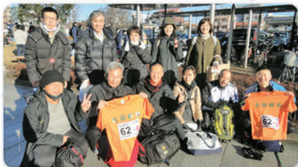
※写真撮影のためマスクを外しています。