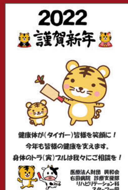
リハビリテーション科