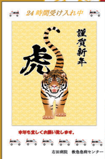
救急急病センター