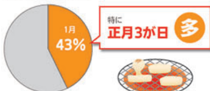
餅による窒息事故

高齢になると口腔や喉の機能が変化し嚥む力、飲み込む力が弱くなります。嚥下に必要な咽頭周囲の筋力も低下してきます。