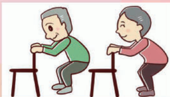
③【スクワット】 10回 安定した物に掴まり、ひざが軽く曲がる程度(45°程度)までゆっくり腰を落とし、また立ち上がります。足の指で地面をつかむことを意識しましょう。