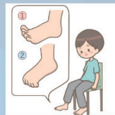
②【足指グーパー】 グーパーを各10回