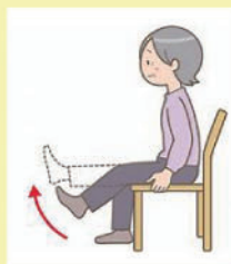
①【ひざの曲げ伸ばし運動】 左右各20回 太ももの前を意識してひざを伸ばしましょう