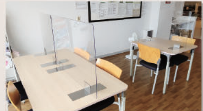
施設仕入管理担当 飯塚 光明