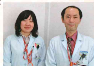
看護部医療相談室一同

ひと昔前までは、病院に医療相談室があることは珍しい時代でした。今は高齢者社会において制度が複雑化しており、保険も医療保険と介護保険の大きく2本立てで運用されています。医療が中心の病院にも福祉の専門職であるMSWが配置されているのが当たり前の時代になりました。それは病院としてただ退院すれば良いという事ではなく、退院後の先を見据えて、地域でサポートする必要があるからだと思えます。たまに外来で退院した患者様に会うと、やはり入院中の病衣よりも私服の方がとても素敵だなと思えます。何か相談等がある時、院内で水色の白衣を見かけたら、お気軽にお声かけください。