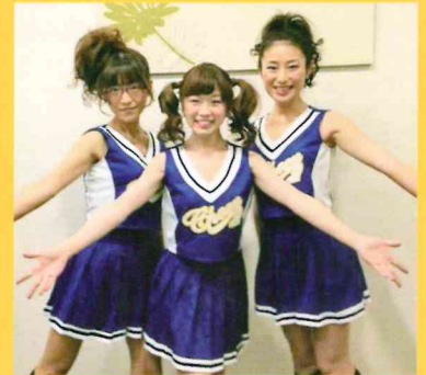
Dr&Nsで構成されるチアリーダー 「あなたに襷を継げ隊」も全力応援！