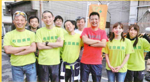
レース(打ち上げ?)終了後の集合写真 充実感と満足感で笑顔が弾ける☆