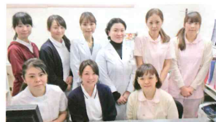
スタッフ一同、笑顔でお出迎え☆