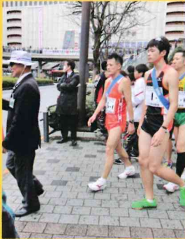
これからレース開始！ スタート前の緊張の一瞬！