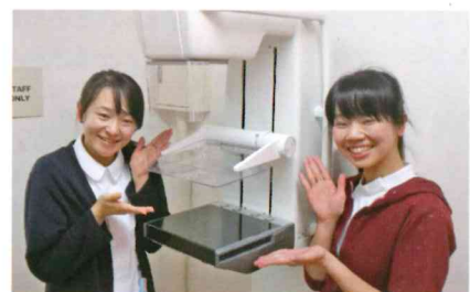
マンモグラフィーと技師さん