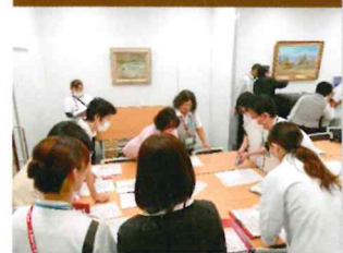
被害状況掲示・確認