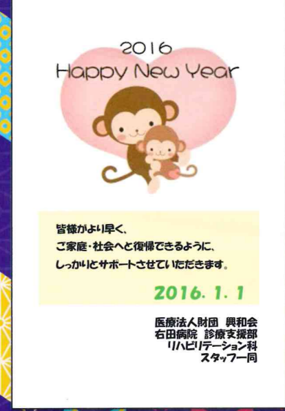
リハビリテーション科