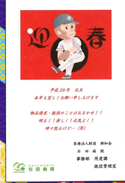
用度課・施設管理室