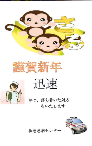
救急急病センター