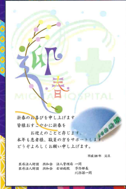
法人管理局・総務課