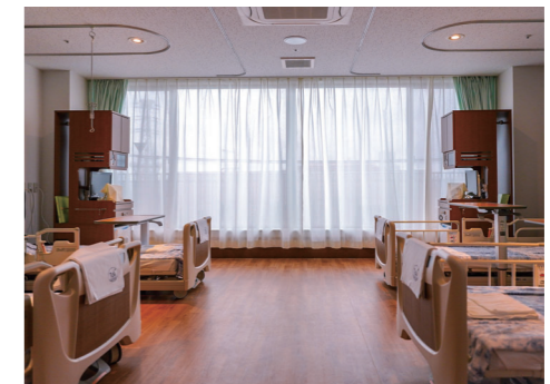
新病棟病室（4人部屋）

理念として掲げてきた「地域のかかりつけ」機能を有する医療機関として、救急と入院の両機能を果たすために、適正な入院期間を実現する必要があります。右田病院は「在宅療養支援病院」として在宅診療も手掛けており、今後はますますその機能を拡充する方針で、退院支援の円滑化に寄与してまいります。